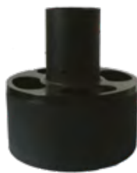
Zklidňovač vtoku bránící víření usazenin v nádrži