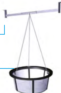
Filtrační koš s jemným sítem k zavěšení do šachty