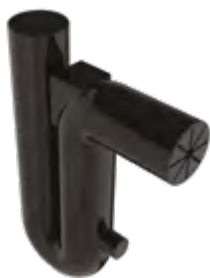
Přepadový sifon se zábranou proti hlodavcům